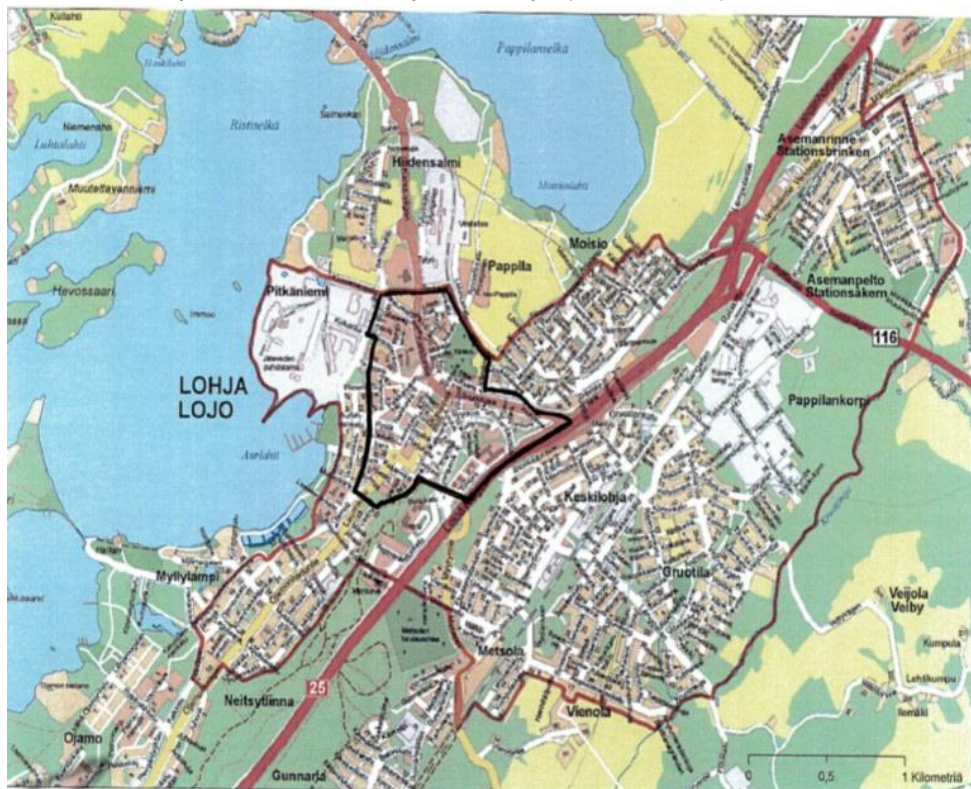
Kartta 1: Kaupunki-maaseuturajaus, Lohja (musta viiva)

Huom: Ero Syken aluetyypologian ja luvun 1 asukaslukujen välillä johtuu eri tilastointiajoista.